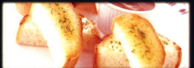
ガーリックトーストカレーディップ