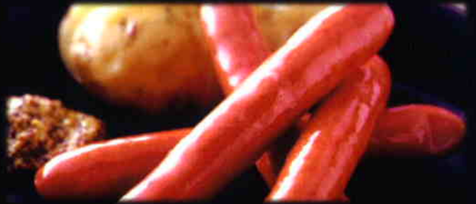
ドイツウィンナー & ポテト