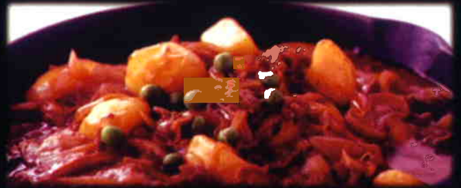
名物鉄板ハイシビーフ