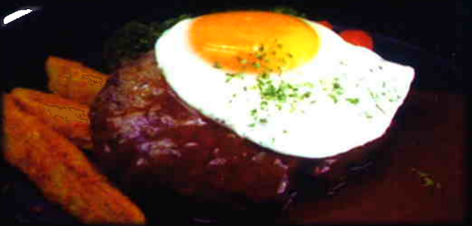
グリルハンバーグ